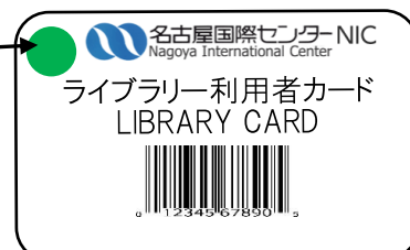
ライブラリー利用者カード