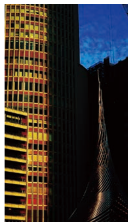
22. Jorge Tallon "Morning Nagoya" (Manhã de Nagoya)

Resultado da votação no Balcão de Informações (da esquerda para a direita, 1º, 2º e 3º lugares)