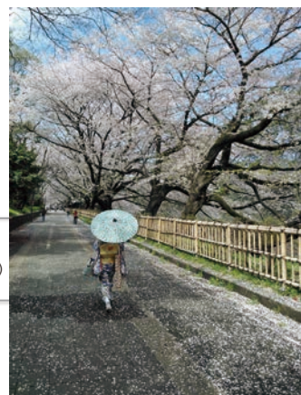
5. Charles Keller "Sakura Stroll" (Passeio pelas cerejeiras)