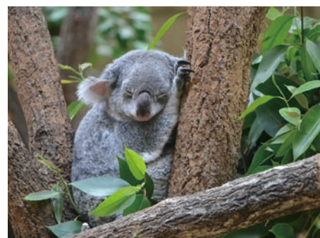
17. Mrunal Bedekar "Innocent koala" (Coala inofensivo)