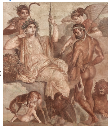
[Hércules encontrando seu filho Télefo], acervo do Museu Arqueológico Nacional de Nápoles

Sorteio de ingressos: serão sorteados pares de ingressos para a exposição. Os interessados deverão enviar E-mail até o dia 25 (segunda) de julho, informando nome e endereço completos e telefone de contato.