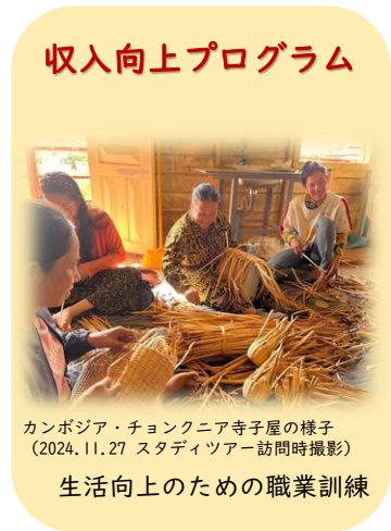
カンボジア・チョンクニア寺子屋の様子 (2024.11.27 スタディツアー訪問時撮影)