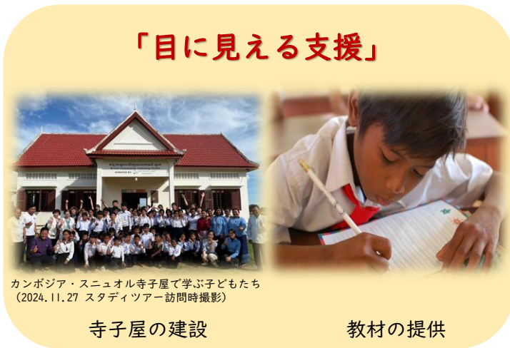
カンボジア・スニョオル寺子屋で学ぶ子どもたち (2024.11.27 スタディツアー訪問時撮影)

“世界寺子屋運動”では 現地の人々の自立につながる、 彼らのニーズを大切に支援活動を行っています。