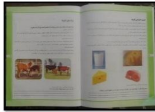
教具・教材の提供