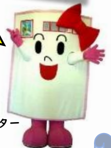
キャンペーンキャラクター 「はがきちゃん」