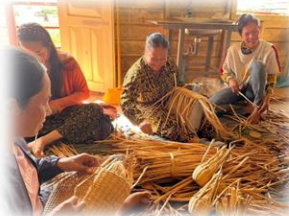
生活向上プログラム

“世界寺子屋運動”では、現地の人々の自立につながる、彼らのニーズを大切にされた支援活動を行っています。