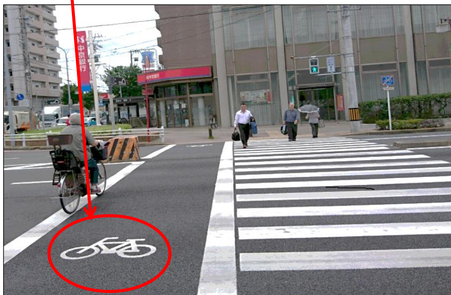
自転車横断帯が ある 横断歩道