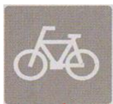
自転車横断帯 の絵