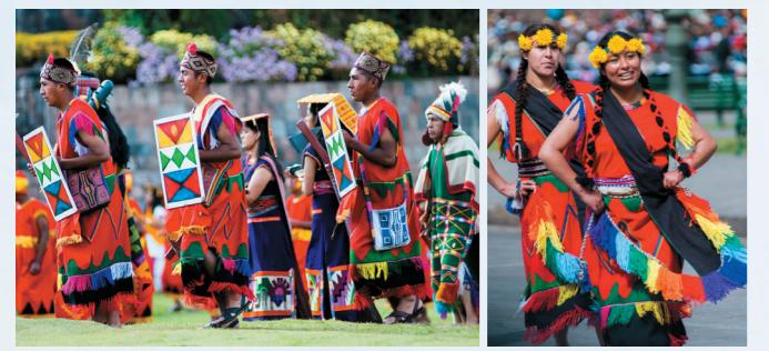
答え: C → 山の上にある古い町「クスコ」で行われます。