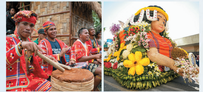
答え: A, B, C → 答えは全部! 特にダバオのマンゴーは世界で有名です。