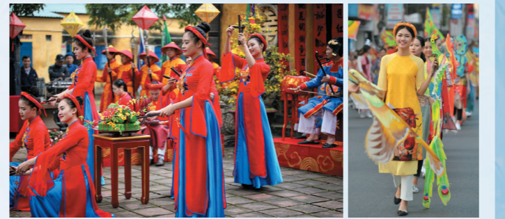
答え: B → 歴史や文化が大切に残されている「世界遺産」のひとつです。