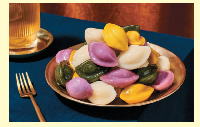
Toraii Republic