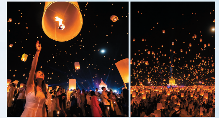
答え: A → 軽い「紙と竹」を使っていて、火の力で空に浮かび上がります。