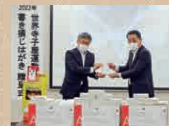
日本労働組合総連合会 愛知県連合会(連合愛知)

新型コロナウイルス感染症拡大防止のため、はがき仕分けボランティアの活動が縮小しており、いただいたご寄付へのお礼が遅れる場合がございます。あらかじめご了承ください。