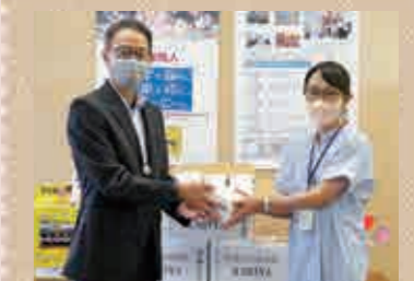
世界寺子屋運動 KARIYA実行委員会 事務局:刈谷市社会福祉協議会